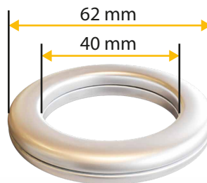
Kółko - przetotka do zasłon